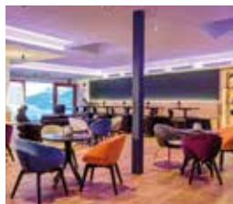
Monte Silva Bistro