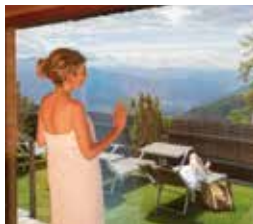
Bio - Kräutersauna