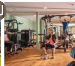
Monte Silva Fitness